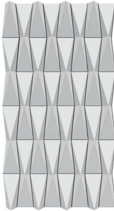
Diagrama colocación del producto