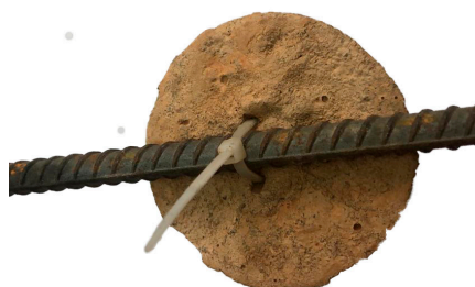
Amarra plástica de cierre rápido