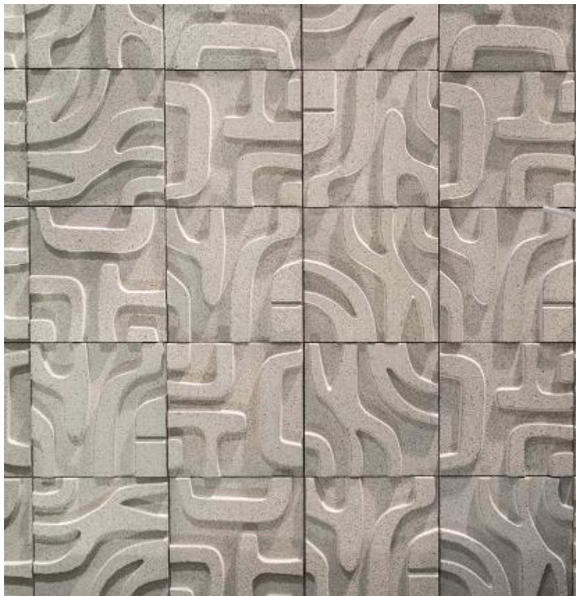
Dimensiones y Colores